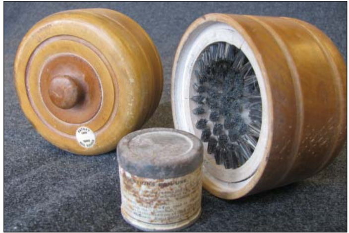
Boldrensere m. talkum – begyndelsen af det 20. århundrede

Tennisbolde er en lige så vigtig del af udstyret som ketcheren. Dårlige bolde ødelægger spil-