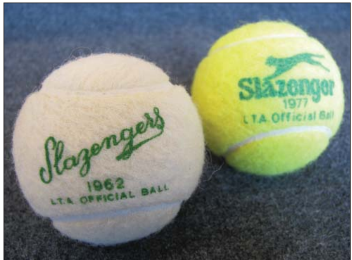
Fra hvid til gul

Allerede tidligt blev man opmærksom på at gummiet ikke var helt tæt, og at bolden derfor tabte sit tryk over tid, og i særdeleshed ved spil. Nogle producenter, især de amerikanske, lagde derfor deres bolde i trykdåser lig dem vi ser i dag, mens andre producenter fortsatte med at levere i papæsker. I katalog fra 1969 reklamerer tennisforretningen "White Sport" på Østerbro for sidstnævnte, med "friske forsyninger fra England – hver uge"! Det svenske firma